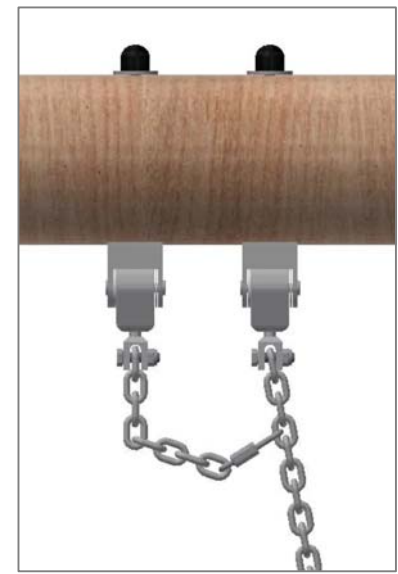
Chaîne de sécurité: Mouqueton à fixer dans le 4ème maillon