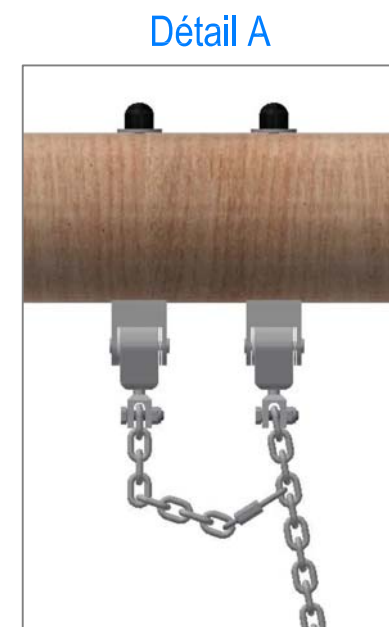
Chaîne de sécurité: Mousqueton à fixer dans le 4ème maillon