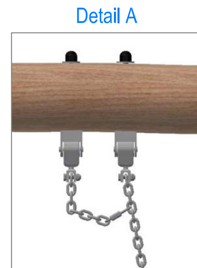
Sicherungskette: Rapid-Schnellverschluss am vierten Kettenglied von oben befestigen