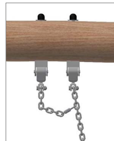
Chaîne de sécurité: Mousqueton à fixer dans le 4ème maillon