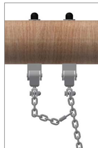
Chaîne de sécurité: Mousqueton à fixer dans le 4ème maillon