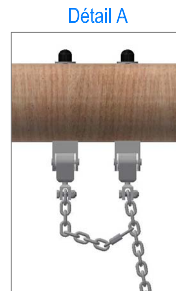
Chaîne de sécurité: Mousqueton à fixer dans le 4ème maillon