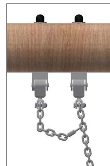
Chaîne de sécurité: Mouqueton à fixer dans le 4ème maillon