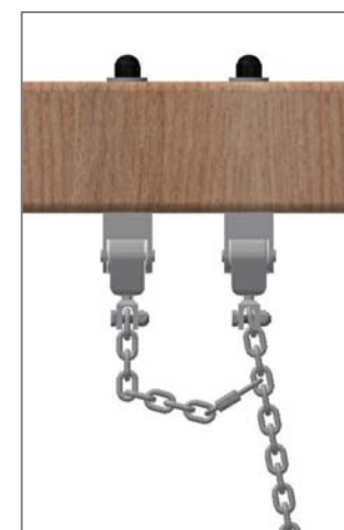
Chaîne de sécurité: Mousqueton à fixer dans le 4ème maillon