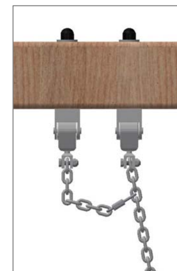
Chaîne de sécurité: Mousqueton à fixer dans le 4ème maillon