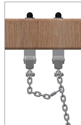
Chaîne de sécurité: Mousqueton à fixer dans le 4ème maillon