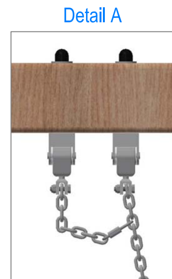
Sicherungskette: Rapid-Schnellverschluss am vierten Kettenglied von oben befestigen