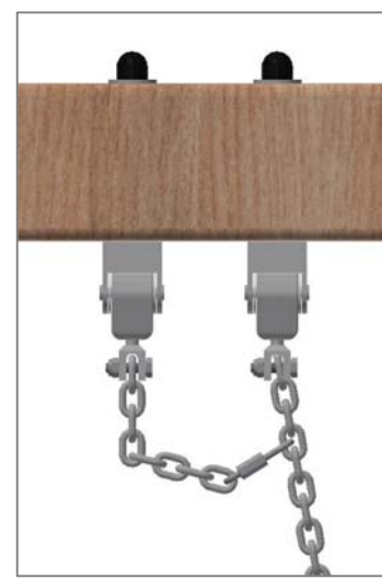
Chaîne de sécurité: Mouqueton à fixer dans le 4ème maillon